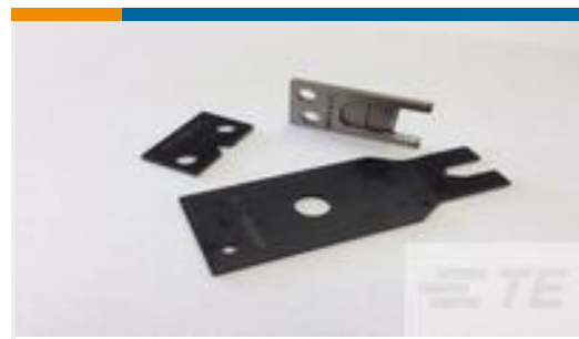
TE 产品编号1-2217206-4 Blade, Slug