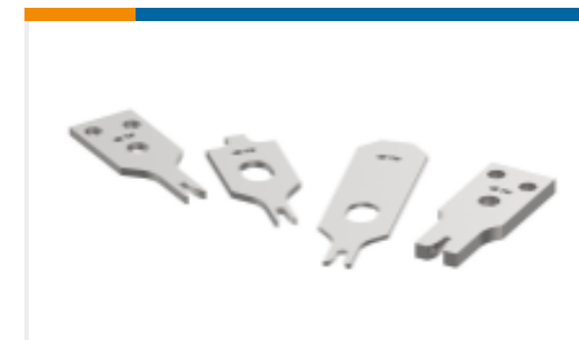
CRIMPER REPRESENTATION ONLY © 2014