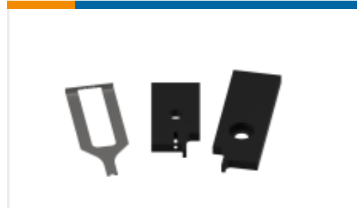
TE 产品编号2119791-6 Depressor, Wire