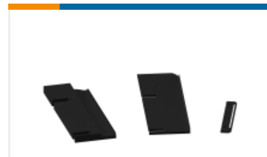
TE 产品编号690438-1 FRONT STRIP GUIDE