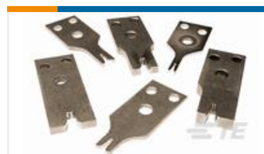
TE 产品编号1-456404-8 CRIMPER, WIRE .070 F