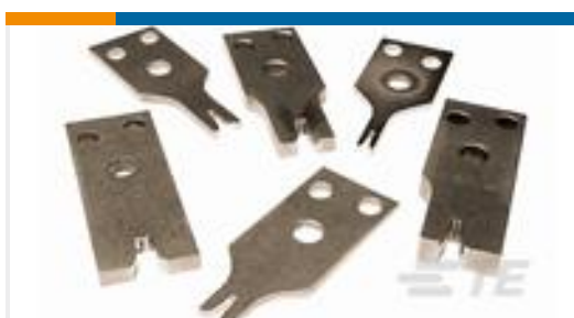
TE 产品编号4-456406-1 CRIMPER, WIRE .090