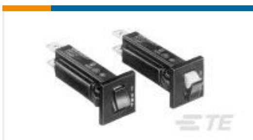
TE 产品编号6-1393250-3 W28-XT1A-10=W28