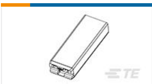
TE 产品编号2-1644125-8 E SPRING .250 (6.3 MM) RECEPTACLE