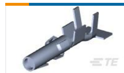
TE 产品编号350557-1 MNL SOK SPECIAL .0126TPBR