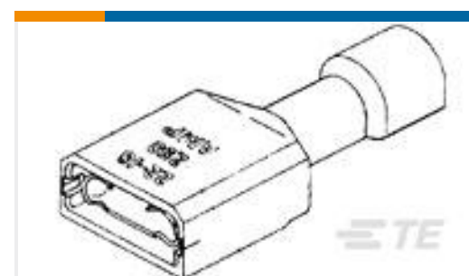
TE 产品编号4-520447-2 ULTRA-FAST 250 ASY REC 12-10 AWG TPBR