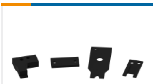
TE 产品编号469366-2 PLATE, SHEAR REAR