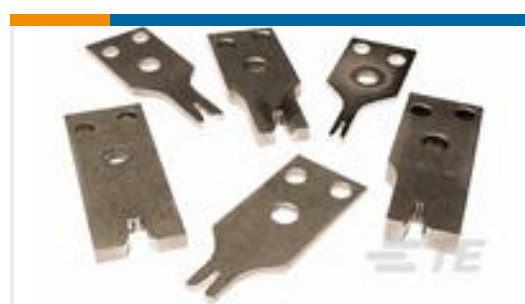
TE 产品编号5-456404-0 CRIMPER, WIRE .070 F