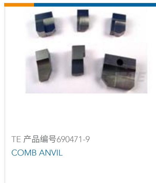
TE 产品编号690471-9 COMB ANVIL