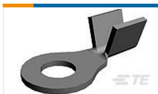
TE 产品编号42111-2 RING TONGUE TERMINAL 18-14 AWG TPBR