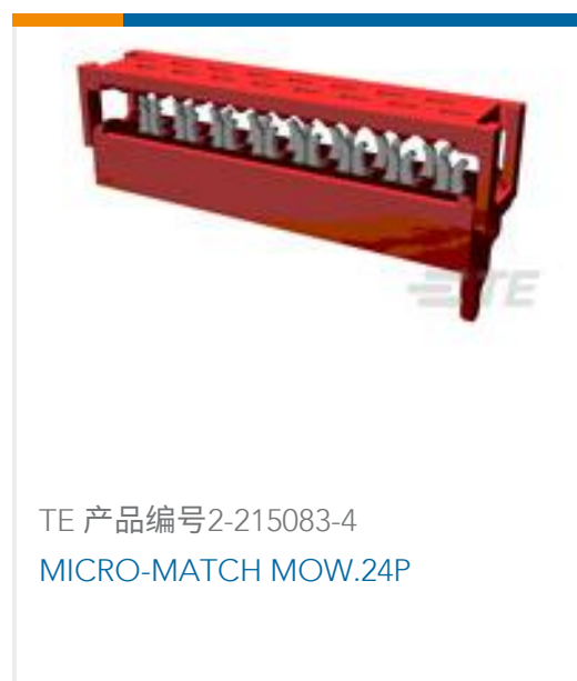
TE 产品编号2-215083-4 MICRO-MATCH MOW.24P