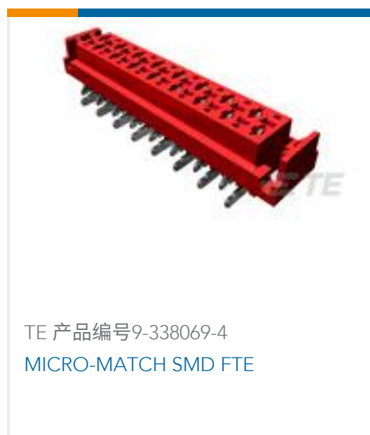
TE 产品编号9-338069-4 MICRO-MATCH SMD FTE