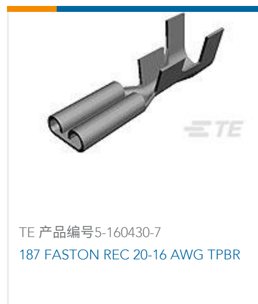
TE 产品编号5-160430-7 187 FASTON REC 20-16 AWG TPBR