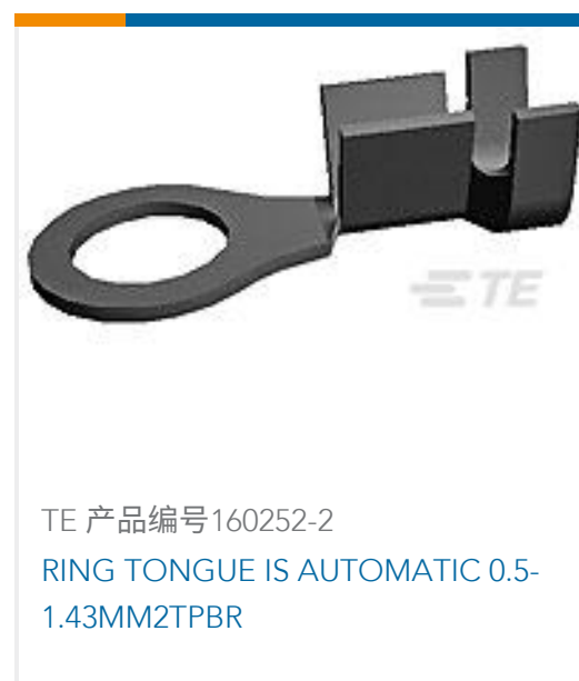
TE 产品编号160252-2 RING TONGUE IS AUTOMATIC 0.5-1.43MM2TPBR