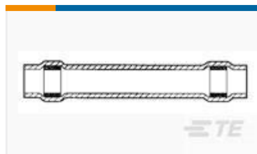
TE 产品编号D17660-000 D-200-82