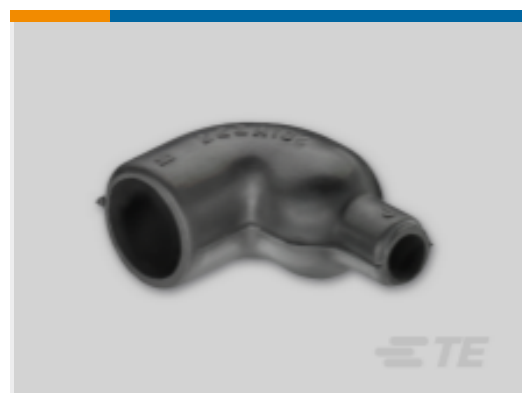
TE 产品编号806823-000 球形热缩护套：有嘴，直角