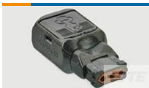
TE 产品编号D369-P33-NS1 369 3 WAY PLUG, CRIMP, SKT