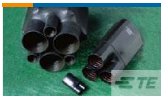
TE 产品编号861763-000 CBR-3-4-A-(B3)