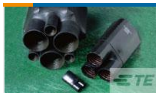
TE 产品编号320457-000 CBR-6-2-A-(B3)