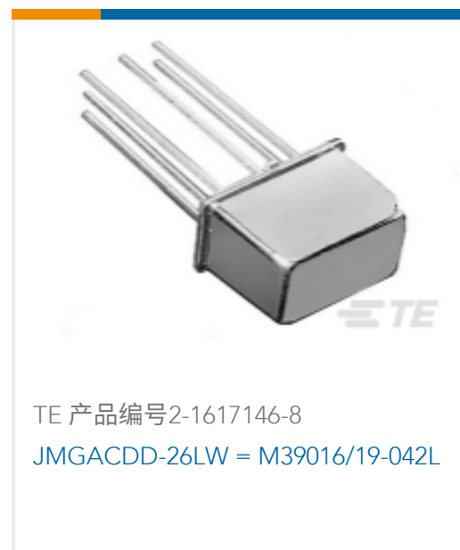
TE 产品编号2-1617146-8 JMGACDD-26LW = M39016/19-042L