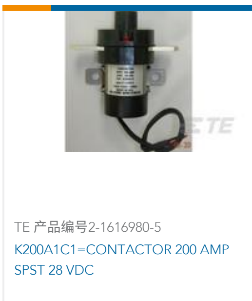
TE 产品编号2-1616980-5 K200A1C1=CONTACTOR 200 AMP SPST 28 VDC