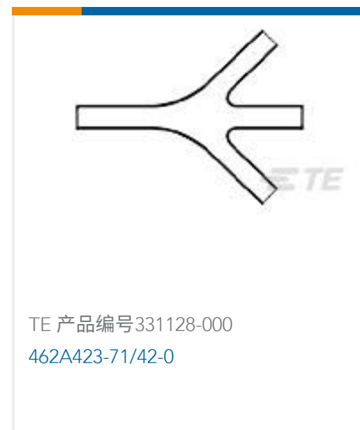
TE 产品编号331128-000 462A423-71/42-0