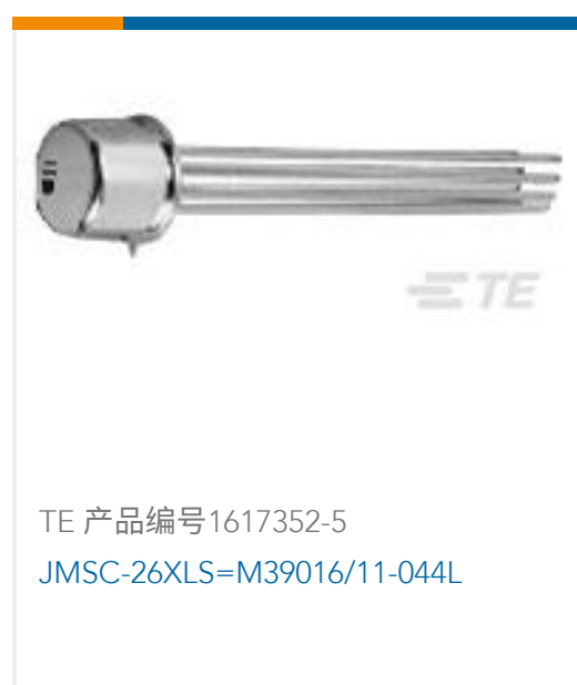
TE 产品编号1617352-5 JM5C-26XLS=M39016/11-044L