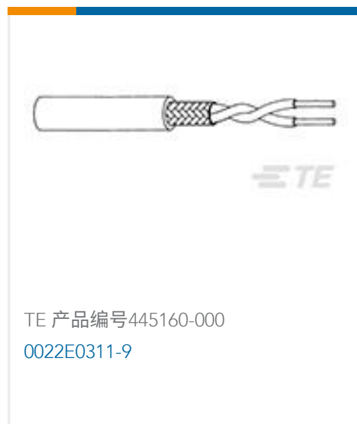
TE 产品编号445160-000 0022E0311-9