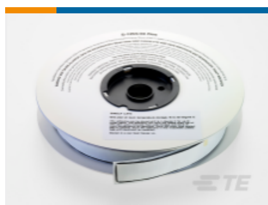
TE 产品编号 195133-000 S1255-04-3/4X100FT