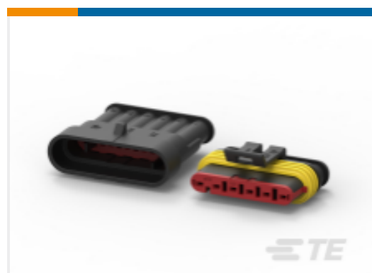
TE 产品编号282104-1 AMP SUPERSEAL 1.5MM, 连接器壳体