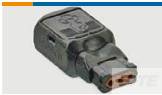
TE 产品编号D369-P33-NS1 369 3 WAY PLUG, CRIMP, SKT