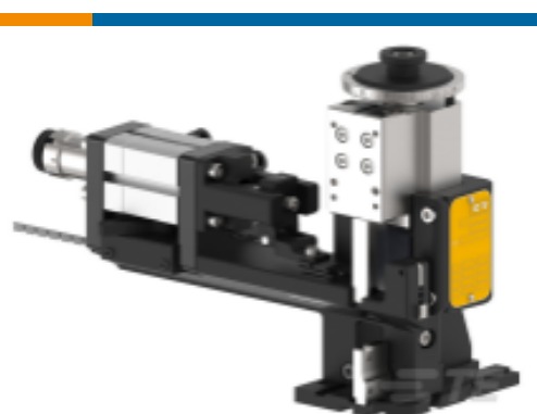
TE 产品编号2335350-3 SYSTEM, INVERTED SPLICE