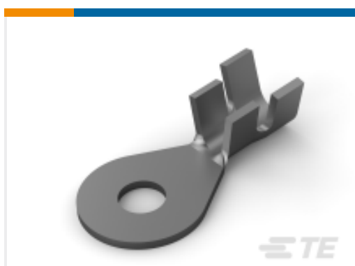
TE 产品编号60399-1 RING TERMINAL 12-10 AWG TPCU