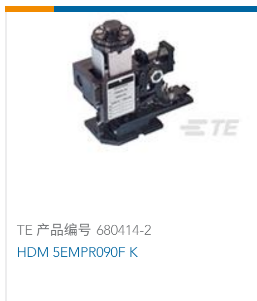
TE 产品编号 680414-2 HDM 5EMPR090F K