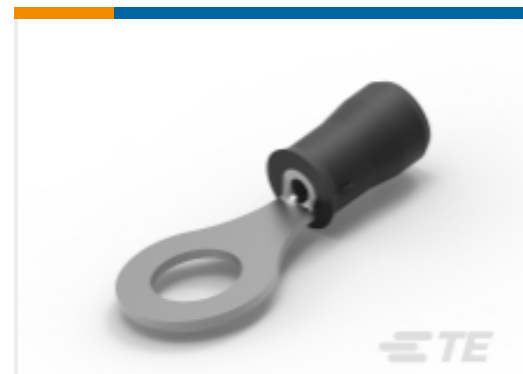
TE 产品编号2-31894-2 PIDG Ring Tongue Terminals