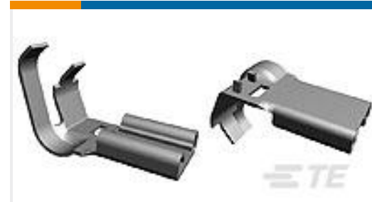
TE 产品编号41532 250 FASTON FLAG REC 18-12 AWG TPBR