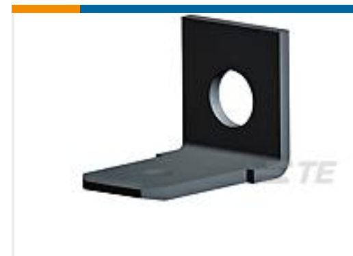
TE 产品编号63971-1 250 FASTON TAB TPBR