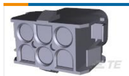
TE 产品编号1-480705-0 06P UMNL CAP HSG NATL