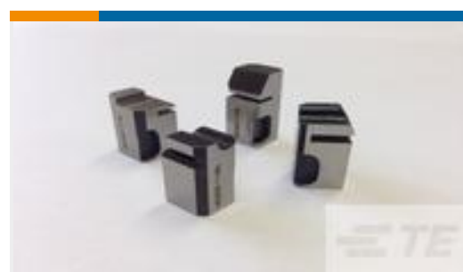
TE 产品编号454276-1 FLOATING SHEAR