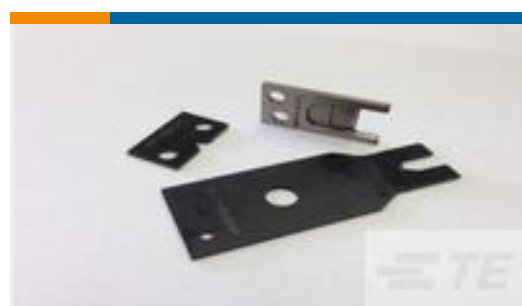
TE 产品编号2217206-5 Blade, Slug