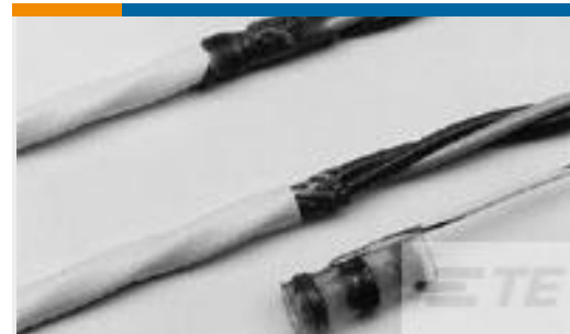
TE 产品编号CR0178-000 CWT-7-W116-9