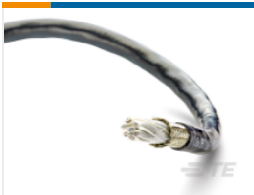
TE 产品编号8163673001 VG-95218-T025-G004