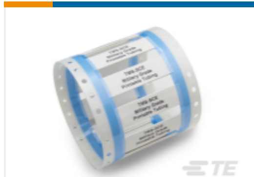
TE 产品编号7677230001 TMS-SCE Military Grade Sleeves