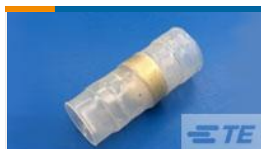
TE 产品编号696453-000 B-053-70