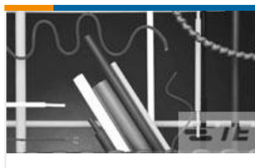
TE 产品编号6758004001 CGPT-19/9.5-4-FSP