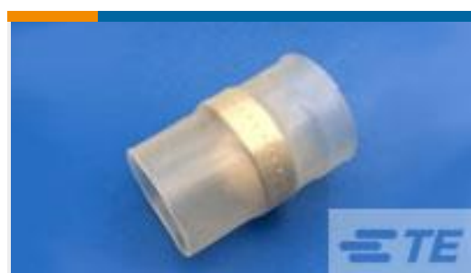
TE 产品编号696684-000 B-051-01-01