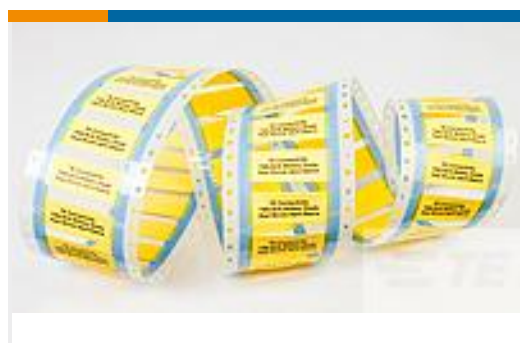
TE 产品编号9246090001 TMS-SCE-1/8-2.0-S1-9