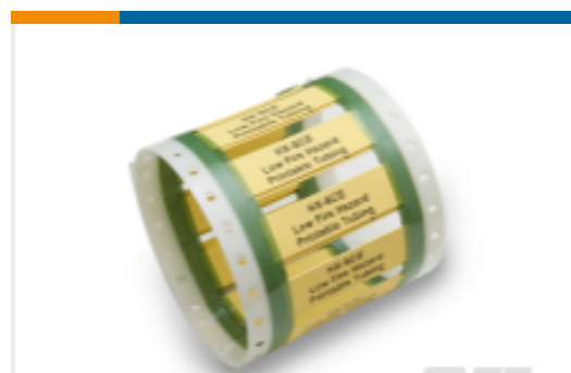
TE 产品编号C97865-000 HX-SCE Low Fire Hazard Sleeves