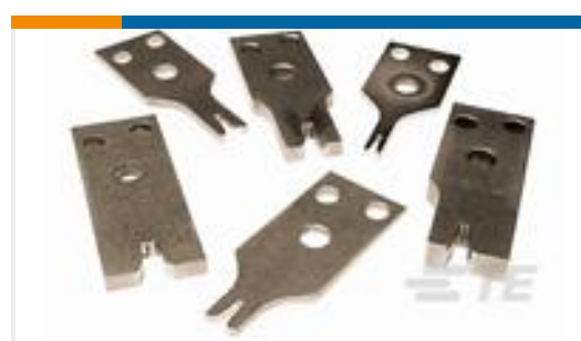
TE 产品编号3-456134-0 CRIMPER INSUL F