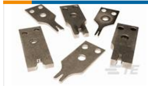
TE 产品编号1-456402-7 CRIMPER WIRE .055 F