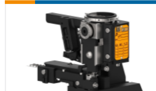
TE 产品编号1803516-1 RAM ASSEMBLY, SF PACIFIC