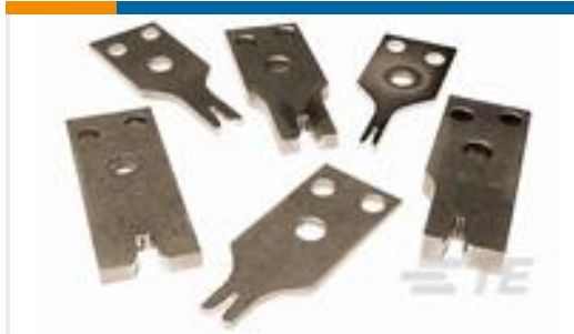
TE 产品编号3-2119784-9 CRIMPER INSULATION O PREMIUM