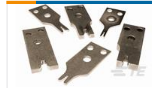
TE 产品编号3-2119784-4 CRIMPER, INSULATION