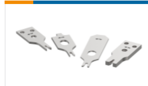
CRIMPER REPRESENTATION ONLY TE 产品编号1-1803248-0 CRIMPER, INSULATION O PREMIUM