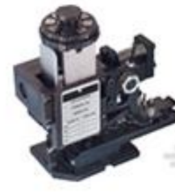
TE 产品编号 466737-3 HDM 5EMPR090F140F G