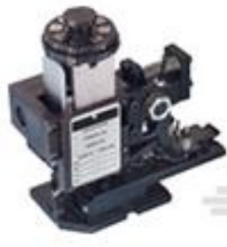
TE 产品编号 466737-1 HDM EMPO090F140FT