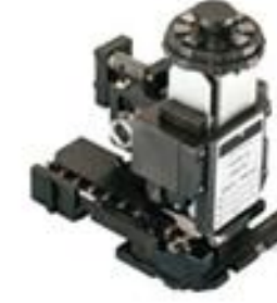
TE 产品编号 687966-2 HDM SMPR090F140FK