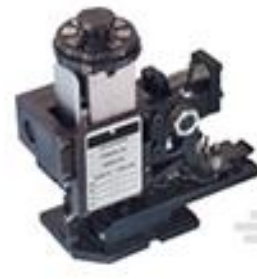
TE 产品编号 466737-2 HDM EMPR090F140FK