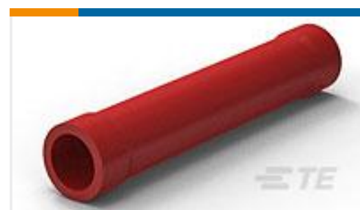
TE 产品编号8-34070-1 PG BUTT SPLC 22-16COMM22-18MIL