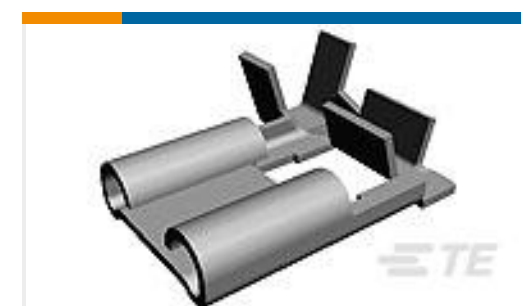
TE 产品编号63010-2 250 FASTON FLAG REC 18-14 AWG TPBR