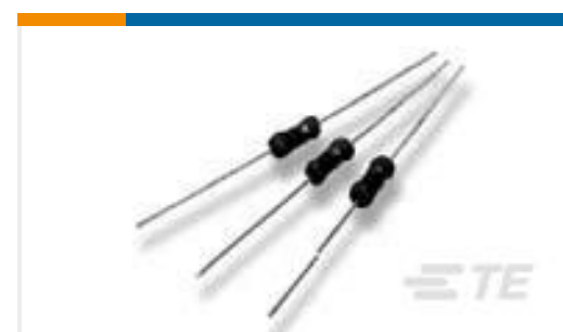
TE 产品编号4-1625892-1 3W SM M/OX 5% 330R