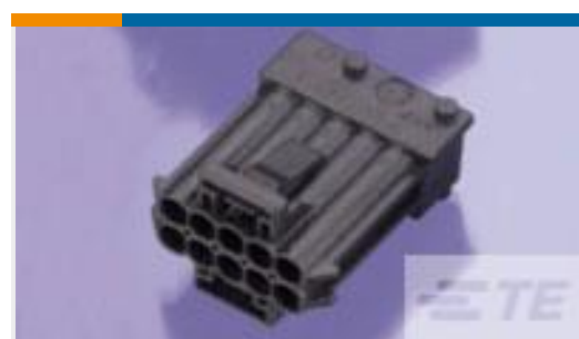
TE 产品编号1-965261-1 FLACHSTE-GEH2,8 4P