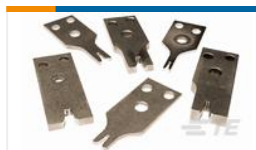
TE 产品编号3-456402-5 CRIMPER "F" .055