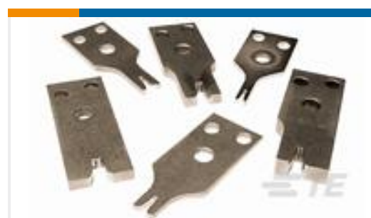
TE 产品编号3-1633738-2 CRIMPER, WIRE F .040