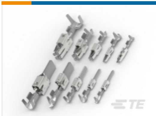
TE 产品编号144433-1 定时器，母端和公端