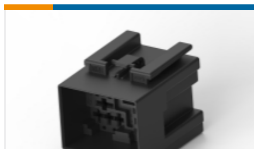
TE 产品编号1801620-2 2 MICRORELAYS HOLDER