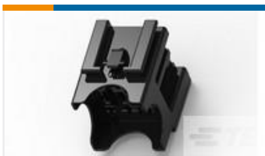
TE 产品编号1801618-1 RELAY 40A HOLDER