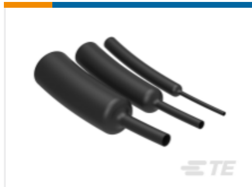
TE 产品编号1929496017 RNF-3000 Heat Shrink Tubing