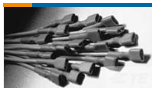
TE 产品编号9097616015 LSTT-4.8-0-50MM