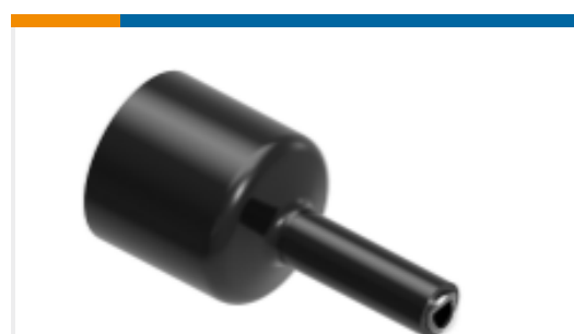
TE 产品编号NB08296001 HTAT-NR524-0-45MM