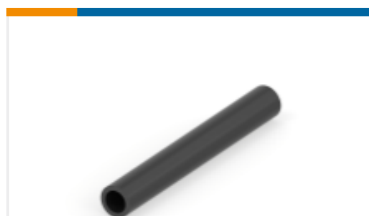
TE 产品编号0989076013 RBK-ILS 热缩管