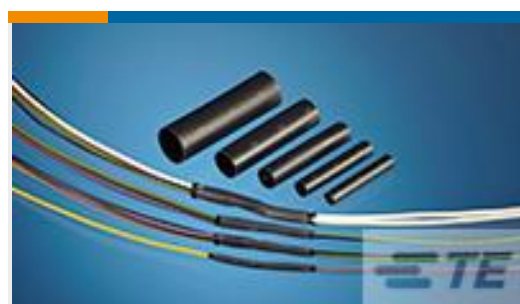
TE 产品编号CH03056001 OSZH-125-NR4-75MM