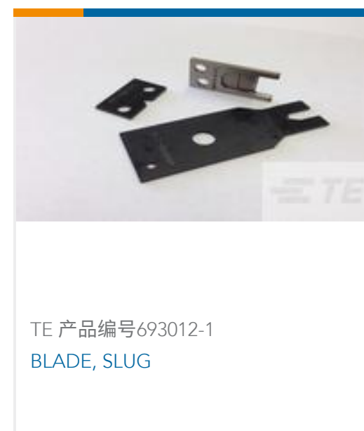
TE 产品编号693012-1 BLADE, SLUG