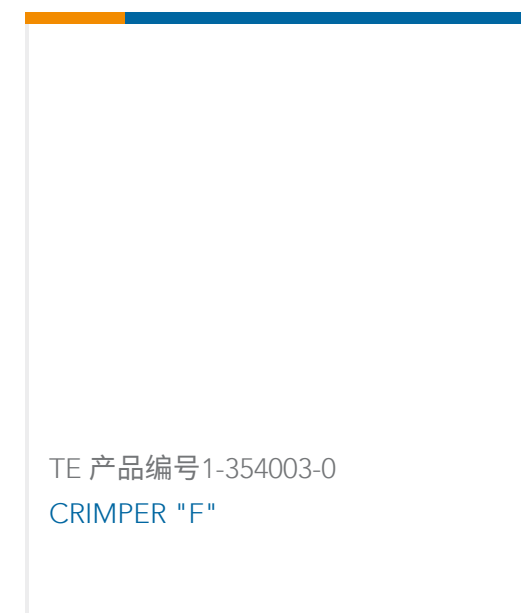
TE 产品编号1-354003-0 CRIMPER "F"