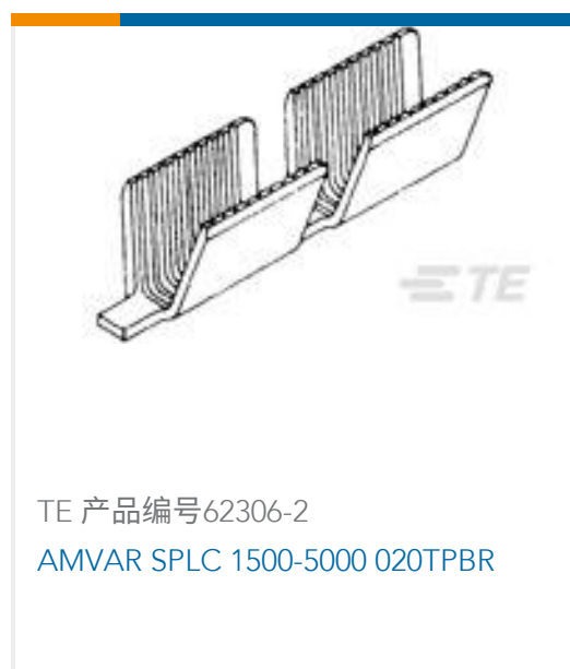
TE 产品编号62306-2 AMVAR SPLC 1500-5000 020TPBR