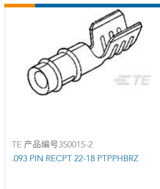
TE 产品编号350015-2 .093 PIN RECPT 22-18 PTPPHBRZ