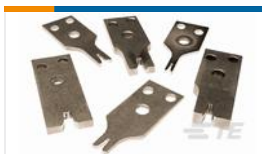
TE 产品编号4-456406-7 CRIMPER, WIRE .090 F