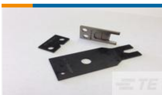
TE 产品编号690474-6 SHEAR BLADE