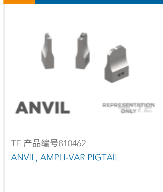
TE 产品编号810462 ANVIL, AMPLI-VAR PIGTAIL