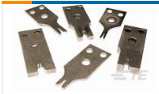
TE 产品编号1-456409-2 CRIMPER WIRE .120 "F"