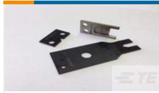
TE 产品编号6911157-1 BLADE, SHEAR