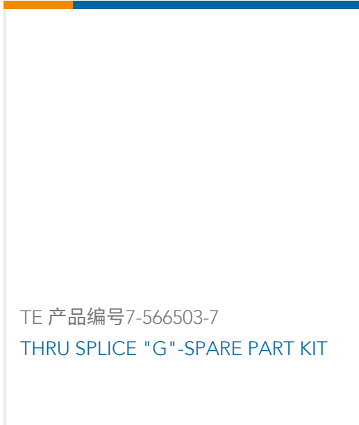
TE 产品编号7-566503-7 THRU SPLICE "G"-SPARE PART KIT