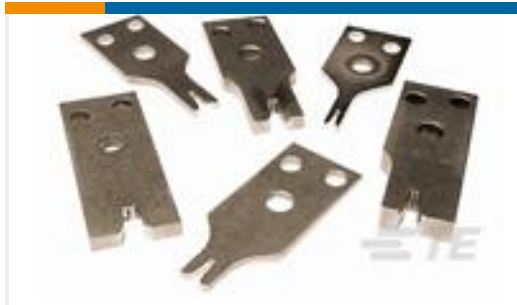
TE 产品编号1-655620-4 ISOLATIONSCRIMPER