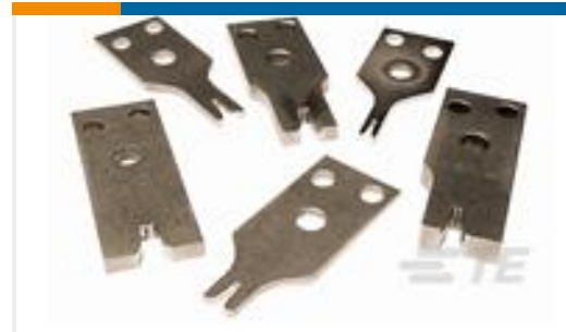
TE 产品编号2-655830-3 ISOLATIONSCRIMPER