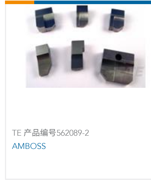
TE 产品编号562089-2 AMBOSS