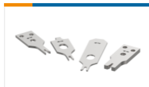
CRIMPER REPRESENTATION ONLY TE 产品编号9-571002-8 INSULATION CRIMPER