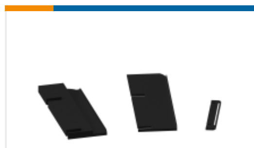
TE 产品编号1320928-2 STRIP GUIDE