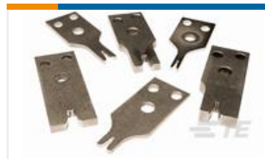
TE 产品编号1-456407-3 CRIMPER, WIRE .100 F