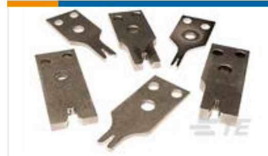
TE 产品编号2-1490019-3 CRIMPER, WIRE (.050" F)