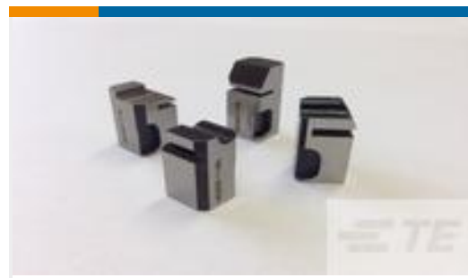
TE 产品编号318707-1 FLOATING SHEAR