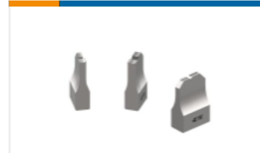
ANVIL REPRESENTATION ONLY TE 产品编号6-1633620-7 ANVIL, COMBINATION