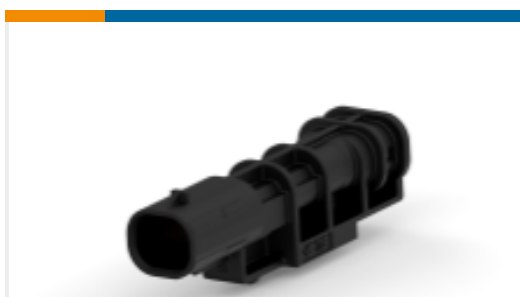
TE 产品编号2292937-2 2POS, 1.2X0.6, TAB HSG ASSY, SLD, COD B