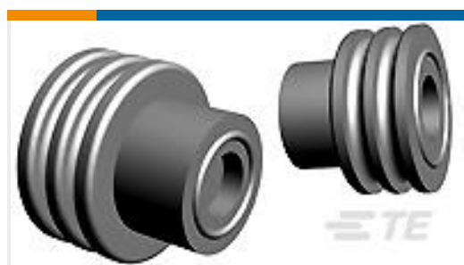
TE 产品编号1823111-1 SINGLE WIRE SEAL, FOR WIRE 2.5 SQMM, BN