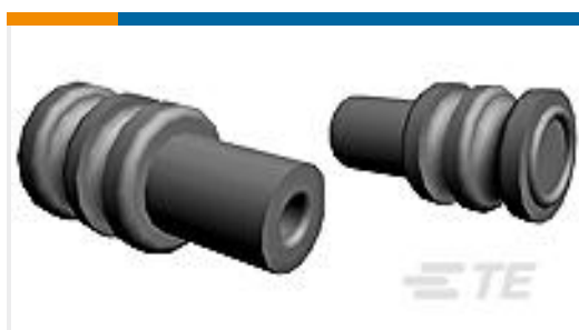
TE 产品编号2112323-1 SINGLE WIRE SEAL,MT 2,VT