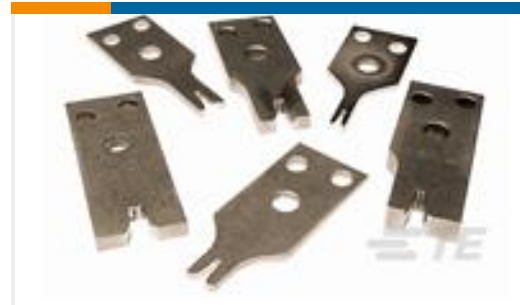
TE 产品编号1-690403-2 CRIMPER INSUL F