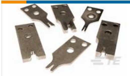
TE 产品编号1-453805-2 CRIMPER, WIRE-.100 WIDE F