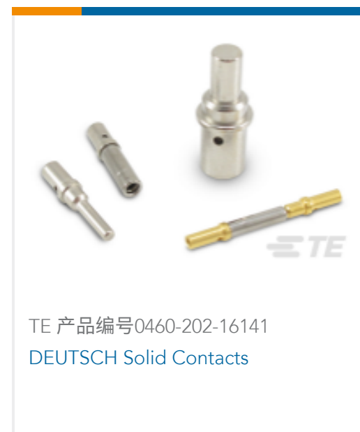
TE 产品编号0460-202-16141 DEUTSCH Solid Contacts