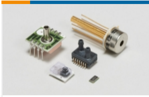
板安装压力传感器(35)