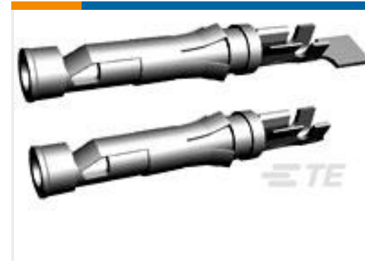
TE 产品编号66598-2 III+ SKT,18-14,30AU/FL,STRIP