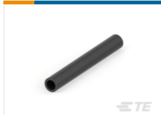
TE 产品编号603891J001 Versafit-V4 Heat Shrink Tubing