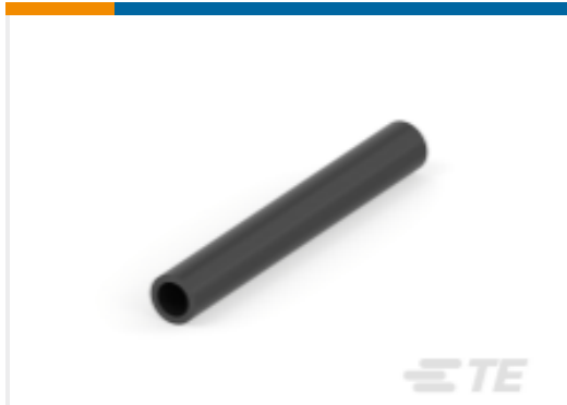
TE 产品编号594045J001 Versafit-V2 Heat Shrink Tubing