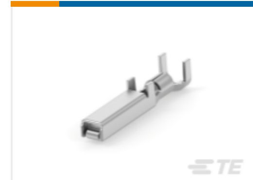
TE 产品编号175286-5 Contact: Component To Wire; 15A, 28-14 wire size