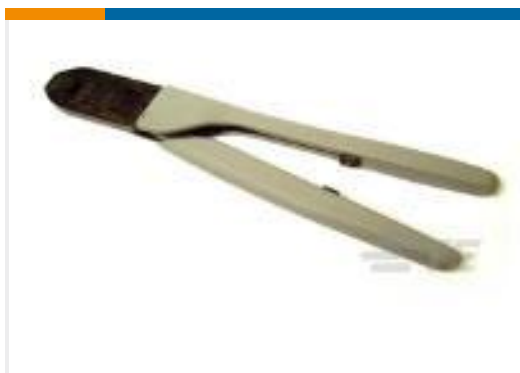
TE 产品编号91512-1 CCII CMNL PIN SKT 24-18 ASSY