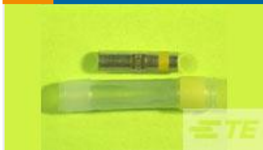
TE 产品编号 650076-000 D-436-38