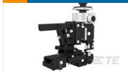
TE 产品编号2151030-1 OCEAN_2.0_APPLICATOR-S-062F110F-RSM