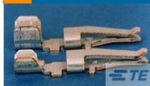
TE 产品编号556136-2 CONT,AMPINRGY WTW,LS PC,10-12