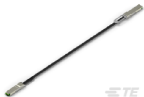
TE 产品编号2333393-7 QSFP 25GIG 30AWG 3 METER