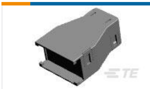
TE 产品编号1986185-1 Strain Relief,6 Posn,D5200 Dynamic. 2