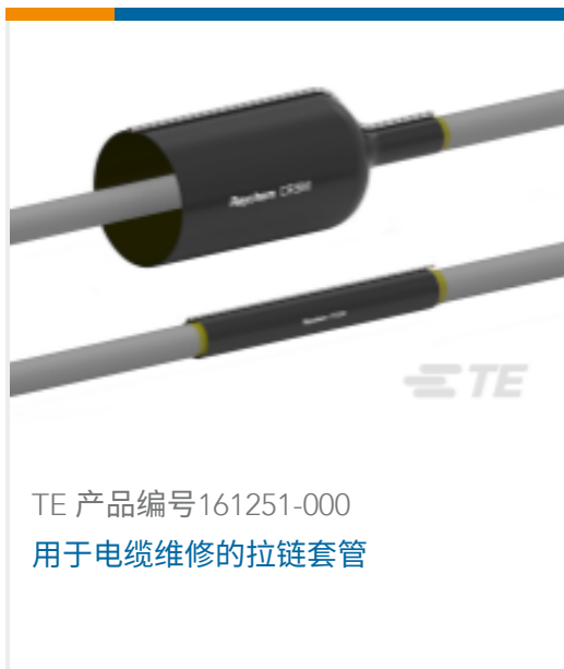
TE 产品编号161251-000 用于电缆维修的拉链套管