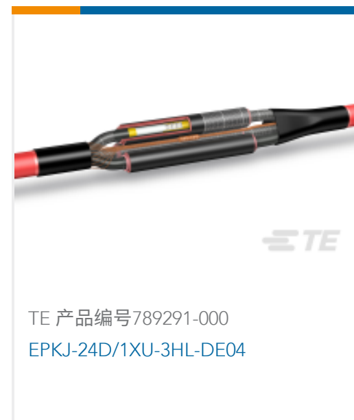
TE 产品编号789291-000 EPKJ-24D/1XU-3HL-DE04