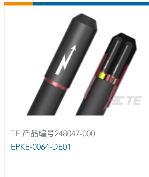
TE 产品编号248047-000 EPKE-0064-DE01