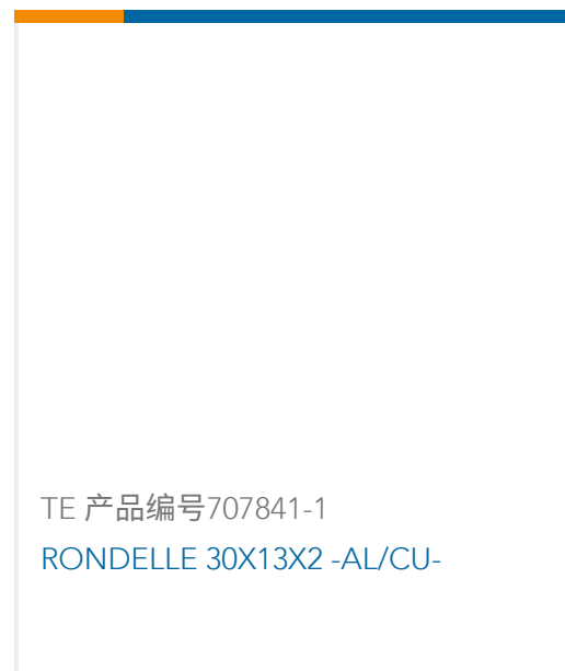
TE 产品编号707841-1 RONDELLE 30X13X2 -AL/CU-