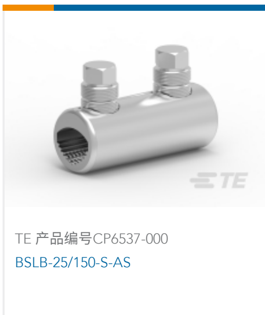
TE 产品编号CP6537-000 BSLB-25/150-S-AS