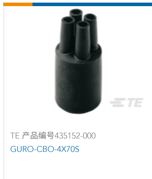
TE 产品编号435152-000 GURO-CBO-4X70S