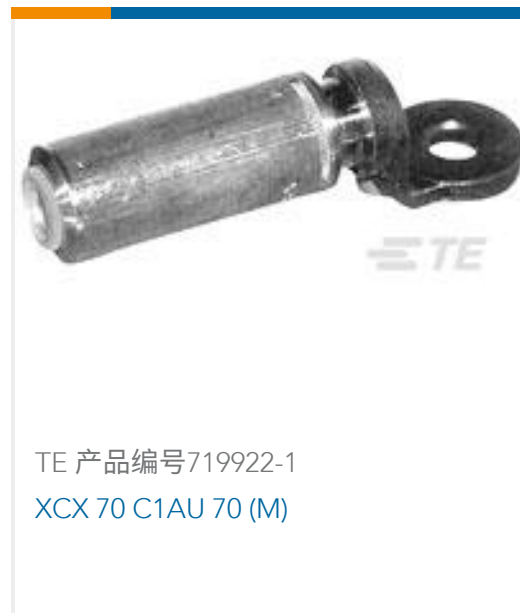
TE 产品编号719922-1 XCX 70 C1AU 70 (M)