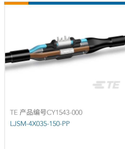
TE 产品编号CY1543-000 LJSM-4X035-150-PP