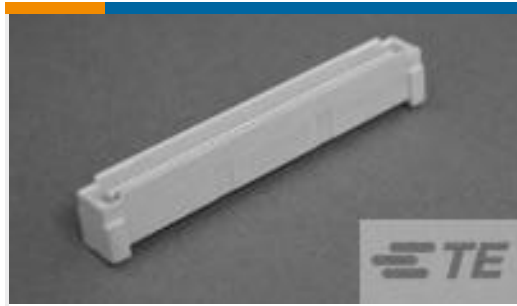
TE 产品编号5179031-1 0.8FH,P08H.5,040,08/Sn,TU