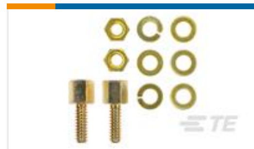
TE 产品编号5205817-1 KIT SCREWLOCK FEMALE