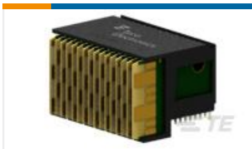
TE 产品编号1410188-3 MULTIGIG RT T2 7RW DC DF F-RGT