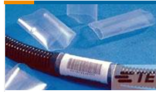
TE 产品编号6209416001 TMS-CCUV-SLEEVE-4-X-65MM