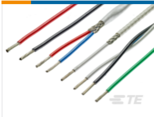
TE 产品编号129721-000 81044/6-12-2