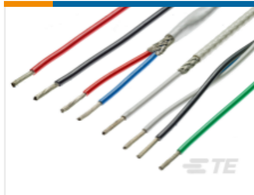
TE 产品编号EM5739-000 44AM4141-12-0/2/5/9-9