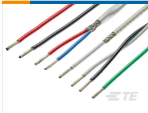
TE 产品编号262241-000 81044/6-4-0