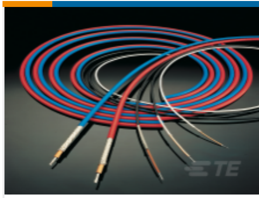
TE 产品编号115722-000 7724S8664-9