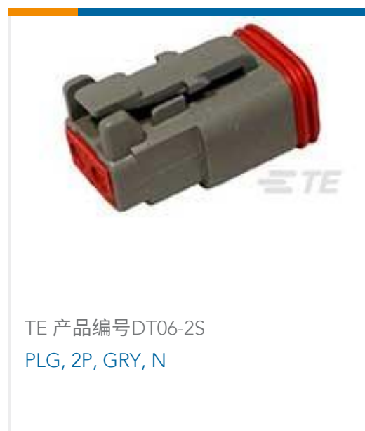
TE 产品编号DT06-2S PLG, 2P, GRY, N