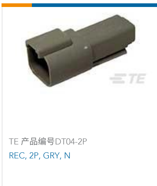
TE 产品编号DT04-2P REC, 2P, GRY, N