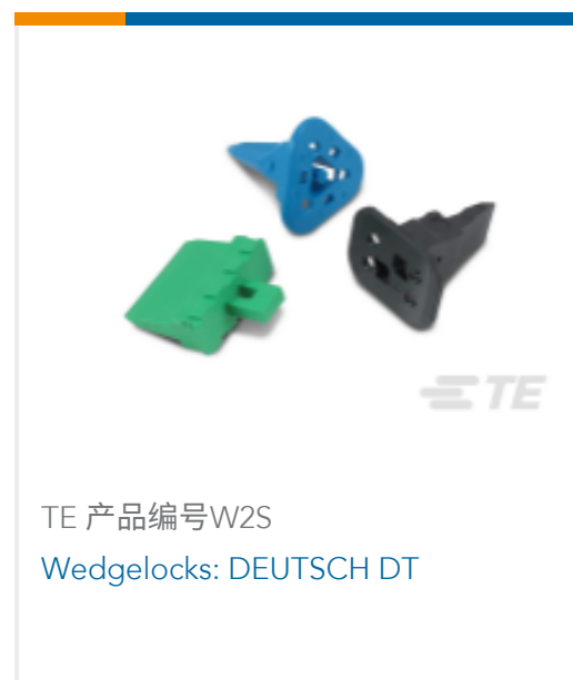
TE 产品编号W2S Wedgelocks: DEUTSCH DT