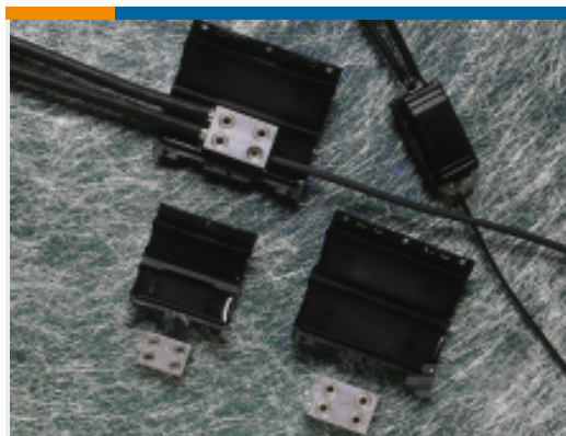
TE 产品编号 566427-000 GTAP-1(B18)