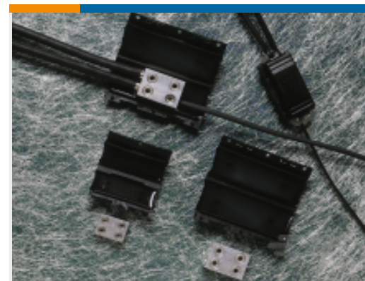
TE 产品编号 981609-000 GTAP-2(B72)