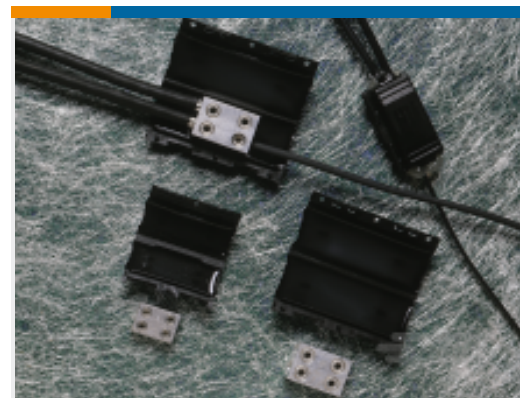
TE 产品编号 888615-000 GTAP-1(B72)