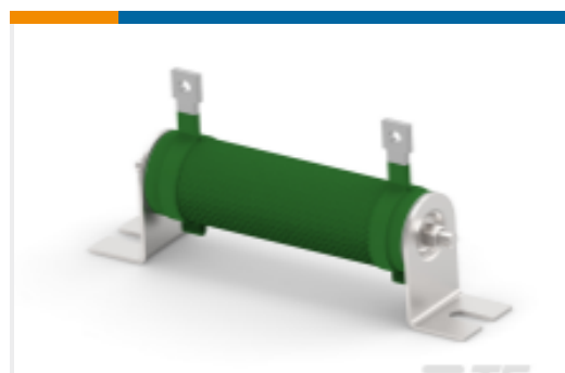
TE 产品编号2-1879450-3 线绕电阻器：矿物，2.5 Kw