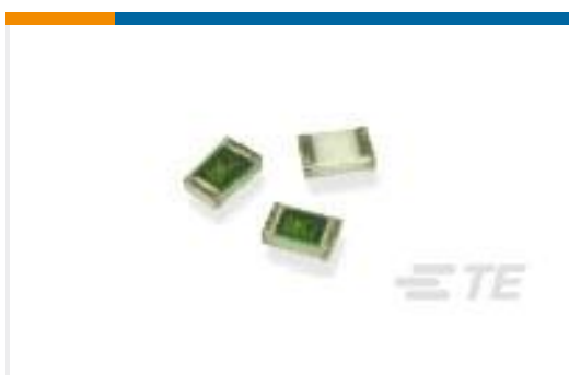
TE 产品编号2176091-1 RP 2A 0.25W 57R6 0.1% 25PPM 1K RL