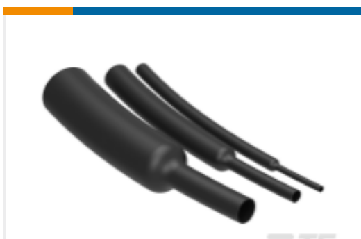
TE 产品编号2898296001 CGPT 2:1 热缩管