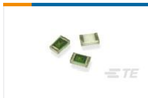
TE 产品编号1-2176091-3 RP 2A 0.25W 76R8 0.1% 25PPM 1K RL