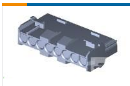
TE 产品编号926309-5 UMNL 10WAY CAP HOUSING