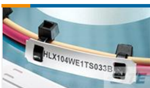
TE 产品编号EC7654-000 HLX203YW1TS050B