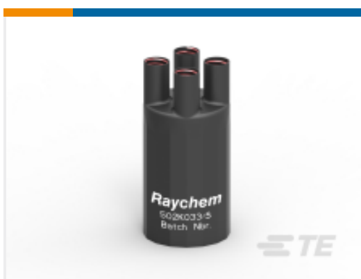
TE 产品编号E00553N001 502K033/S(S15)