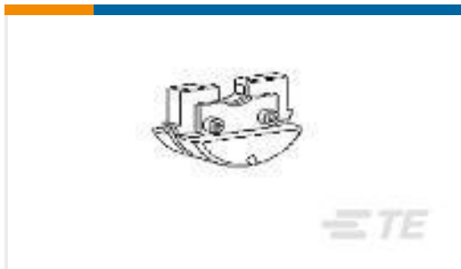
TE 产品编号1752680-4 HYP10 SOLIS FLAG 1/0AWG NEST