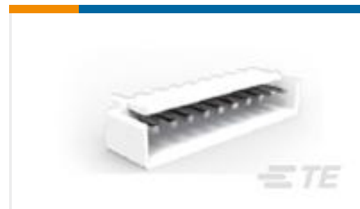
TE 产品编号1-1744427-0 EP Header Assy, Shrouded, 10 Pos, GW