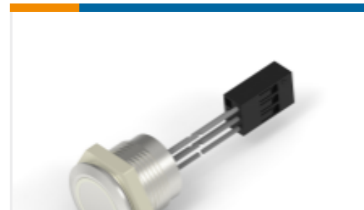
TE 产品编号2342832-4 AVC16L FLAT S04 RED R 500MM/2X3