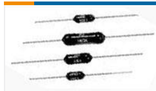
TE 产品编号6-1879655-2 H8 21K5 0.5% 100PPM