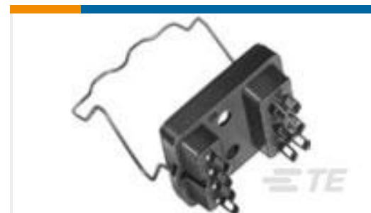
TE 产品编号1393824-8 V23154Z1015