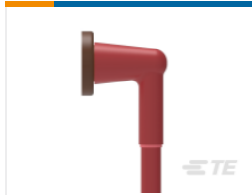
TE 产品编号358133-011 RSRB-6046