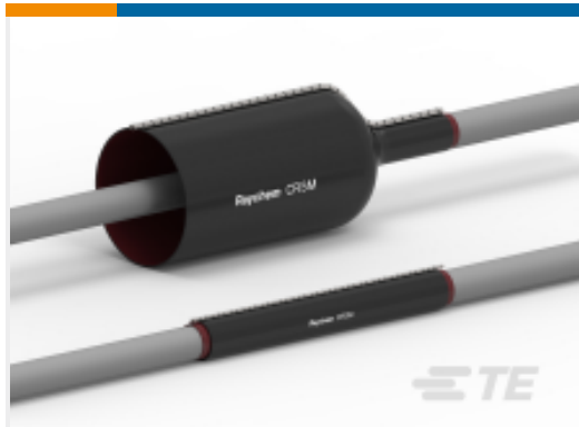
TE 产品编号219483-000 CRSM-84/20-1500/239(S5)