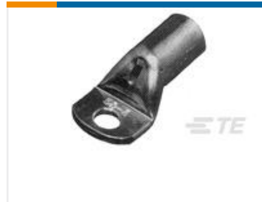
TE 产品编号710025-7 XCT 50-12