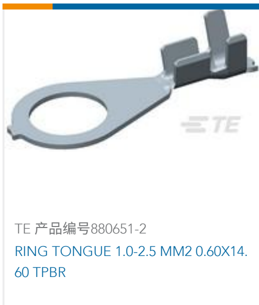
TE 产品编号880651-2 RING TONGUE 1.0-2.5 MM2 0.60X14.60 TPBR