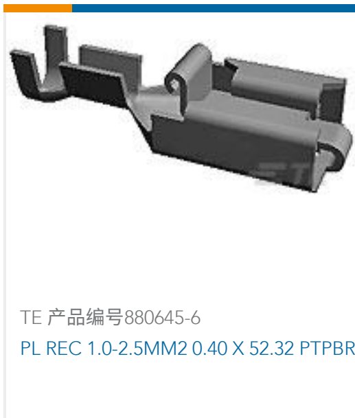
TE 产品编号880645-6 PL REC 1.0-2.5MM2 0.40 X 52.32 PTPBR