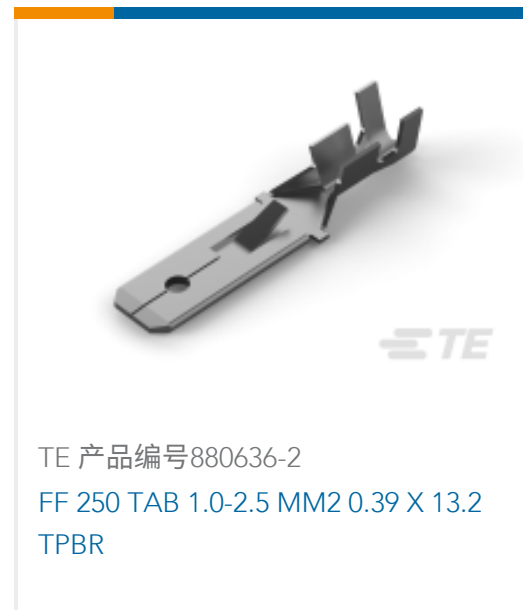
TE 产品编号880636-2 FF 250 TAB 1.0-2.5 MM2 0.39 X 13.2 TPBR