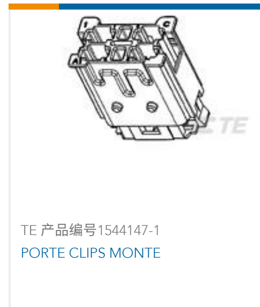
TE 产品编号1544147-1 PORTE CLIPS MONTE