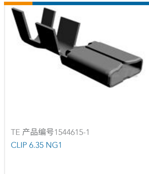
TE 产品编号1544615-1 CLIP 6.35 NG1