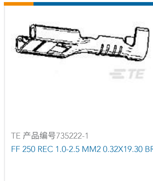
TE 产品编号735222-1 FF 250 REC 1.0-2.5 MM2 0.32X19.30 BR