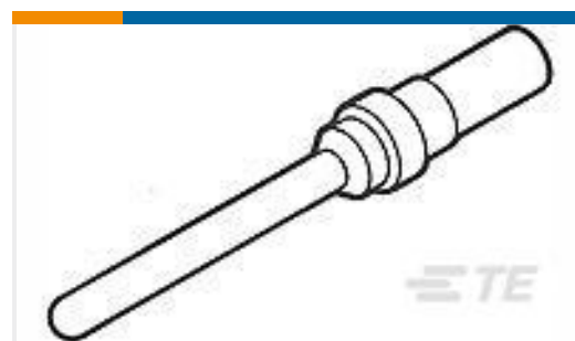
TE 产品编号205089-1 HD 20 PIN CONTACT