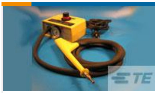
TE 产品编号 281917-000 AA-400-200-CE-SUPRHTR