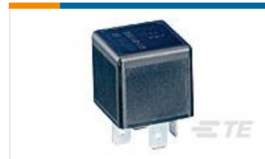
TE 产品编号3-1393303-7 V23134B1053C642-EV-CBOX