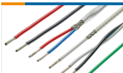
TE 产品编号E65735-000 WXA-0059-24-9CS2972