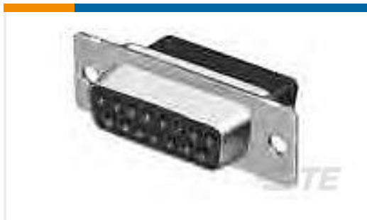
TE 产品编号205209-2 RECP ASSY SIZE 4