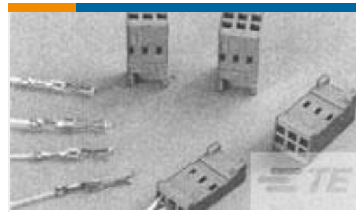
TE 产品编号281839-5 HOUSING HE13 HE14 COSI 2X5 P