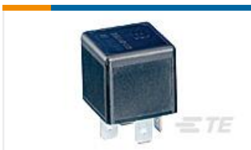
TE 产品编号6-1393302-3 V23134A1053C643-EV-CBOX