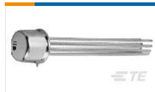
TE 产品编号1-1617121-1 JMAC-26XP = M39016/9-062P