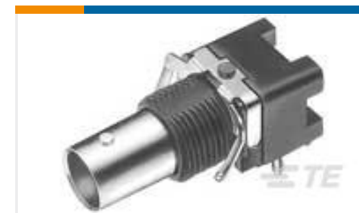
TE 产品编号5413515-9 JACK, DECOUPLER, RTANG, BNC PCB