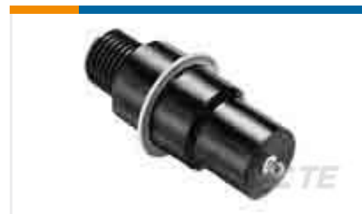
TE 产品编号861253-1 RECEPTACLE