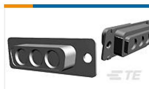
TE 产品编号445705-4 AMPLIMITE,ASY,RCPT,3C3,COAX