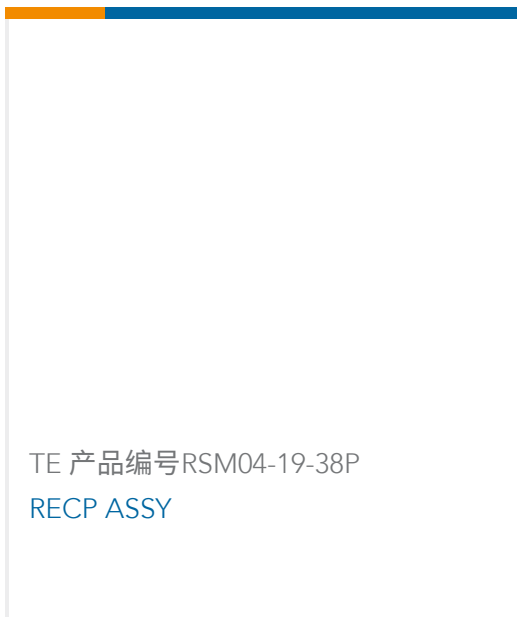
TE 产品编号RSM04-19-38P RECP ASSY