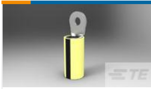
TE 产品编号53049 TERMINAL,PIDG R IR 26 4