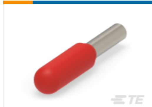
TE 产品编号2332899-1 KIT, EB16 SKT, MM, 126 um, 1.6-2.1 mm